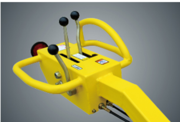
Ergonomically designed handle lever