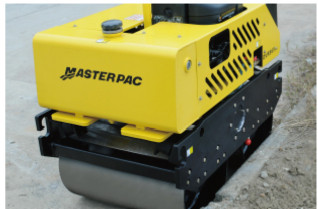
Side and Curb clearance allow for the closest approach to curbs walls and other obstacles