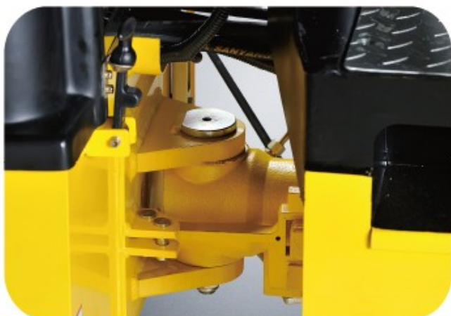
Articulated steering with a maintenance-free hitch and steering cylinder reduces maintenance