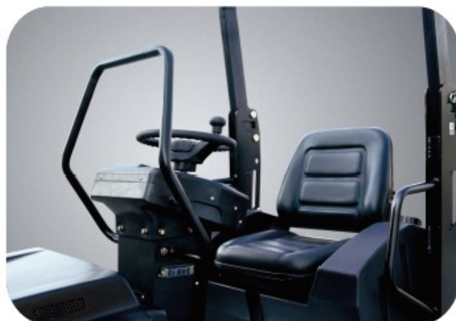
Ergonomic adjustable seat for maximizing the operator comfort