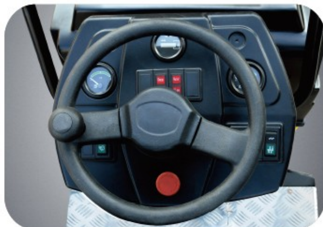
Clean and ergonomic layout of dashboard, variable height adjustment of steering minimizing operator fatigue