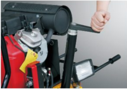
Fine hand control for blade pitch ensures precise blade adjustment.