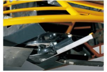
Super heavy-duty gearbox and spider assembly stands up to the most grueling job.