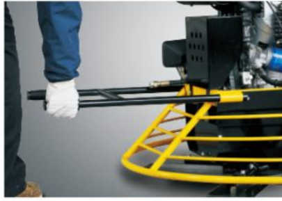
Lifting tube allows trowel to be transported on the job-site with only 4 people.