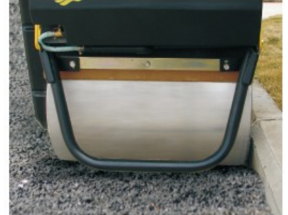
Narrow overhang for operation close to walls and curbs.