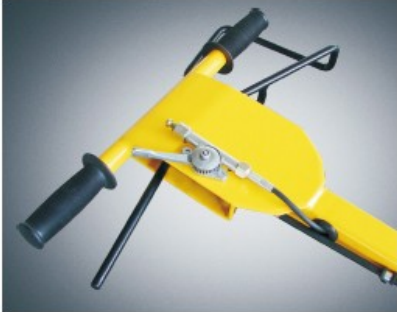
Deadman control and reversing protection.