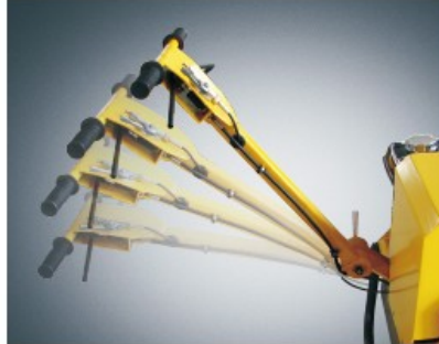
Variable height adjustment for operator's comfort.