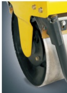
Beveled drum edge.