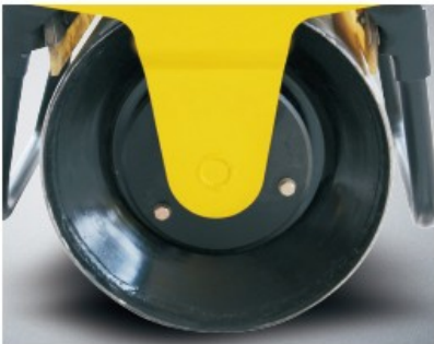
Thick drum shells for longer drum life.